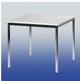
A 402 Tisch (weiß)