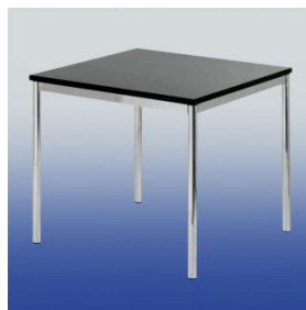
A 4021 Tisch (schwarz)