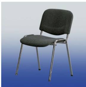
A 4601 Polsterstuhl