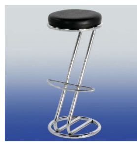
A 4501 Barhocker (schwarz)