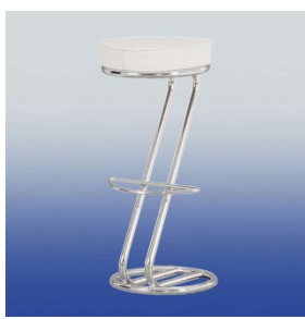
A 450 Barhocker (weiß)