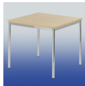
A 4022 Tisch (buche)