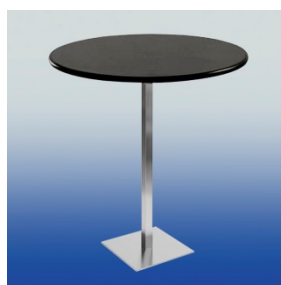
A 4101 Stehtisch (schwarz)