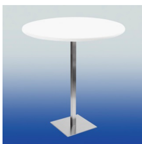
A 410 Stehtisch (weiß)